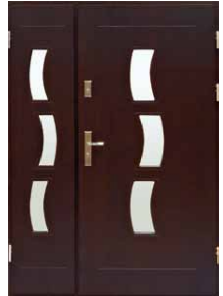
D-Z-K PŁYT + doświetle