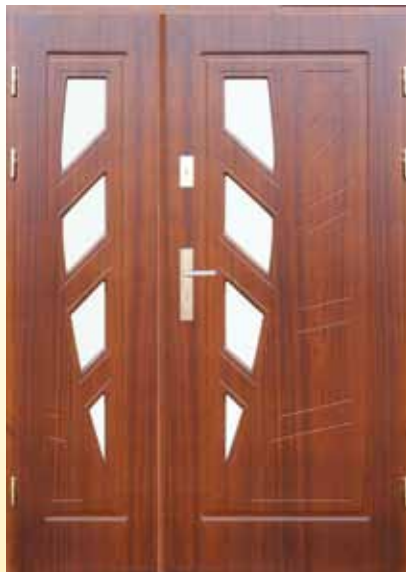
D-Z-L PŁYT + doświetle