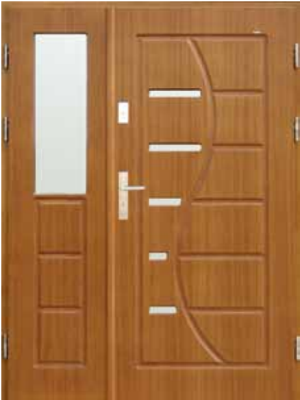
D-Z-S PŁYT + doświetle

W oparciu o typowe wzory możemy dostosować zamówienie do Państwa indywidualnych oczekiwań poprzez dodanie naświetli górnych, doświetli bocznych, zmianę wymiarów, kształtów oraz wzorów.