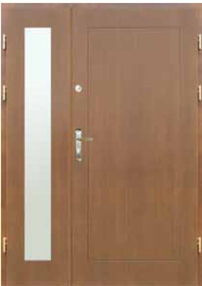
D-Z-1p PŁYT + doświetle