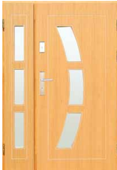
D-Z-C PŁYT + doświetle