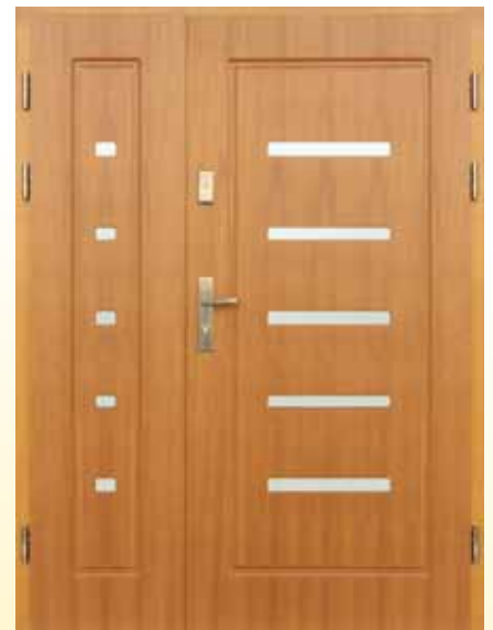
D-Z-D PŁYT + doświetle